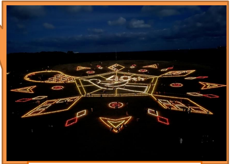
縦100m×横100mのキャンドルアート

高所作業車によるキャンドルアートの撮影は、 予約制（先着順） となります。 ご希望の際は、お早めにご連絡ください。