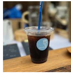
アイスコーヒー 550円

黒真珠のように輝く極深煎りの“エチオピアチエルベサ”は、バラの優しい気品をイメージした甘さの広がるアイスコーヒーです。更に、ケンジーズドーナツ西戸崎 No.13CAFEの焼きドーナツも登場します。