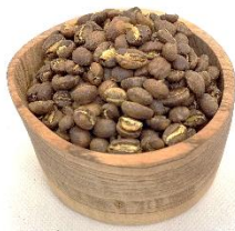
各種コーヒー豆 100g 970円～1,190円