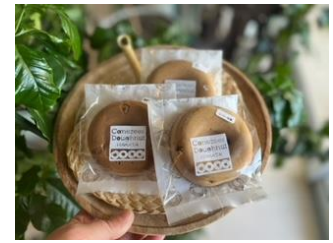
ヴィーガン焼きドーナツ 260円～