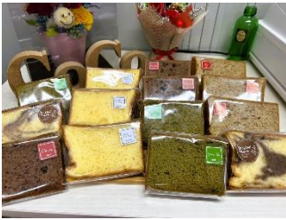
シフォンケーキ 250円

手鍋焙煎が特徴で、苦みの少ない癒やしのスペシャルティコーヒー専門店。ぜひシフォンケーキとご一緒にどうぞ！各種コーヒー豆の販売も行います。